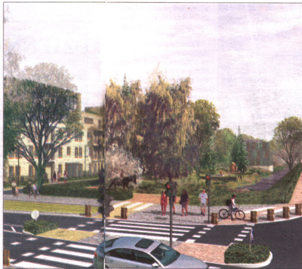
Miasteczko Wilanów: mieszkańcy mówią, że przypomina Kabaty i Natolin

pieszych, przestrzeń publiczną niemal nie istnieje. W Miasteczku Wilanów będziemy się skupiali na tym, żeby każda ulica była atrakcyjna: z szerokimi pasażami, miejskimi meblami, zielenią. W sercu osiedla nie powstanie typowy hiper-