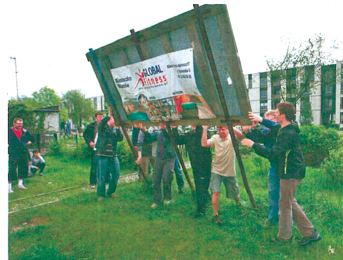
Miasteczko Wilanów stara się o miano najładniejszego osiedla w Europie. Aby poprawić estetykę otoczenia, mieszkańcy zakasali rękawy i sami wzięli się do pracy

Akcja sprzątanina i nasadzeń na terenie Miasteczka Wilanów zbiega się z ubieganiem się przez to wilanowskie osiedle o nagrodę „Za doskonałość” przyznawaną przez Urban Land Institute - międzynarodową organizację pozarządową non profit. W kwietniu tego roku instytucja ta wybrała - spośród 43 osiedli z 17 krajów - 10 finalistów konkursu. Jest wśród nich Miasteczko Wilanów. Czy otrzyma tytuł najładniejszego osiedla w Europie, dowiemy się pod koniec czerwca.