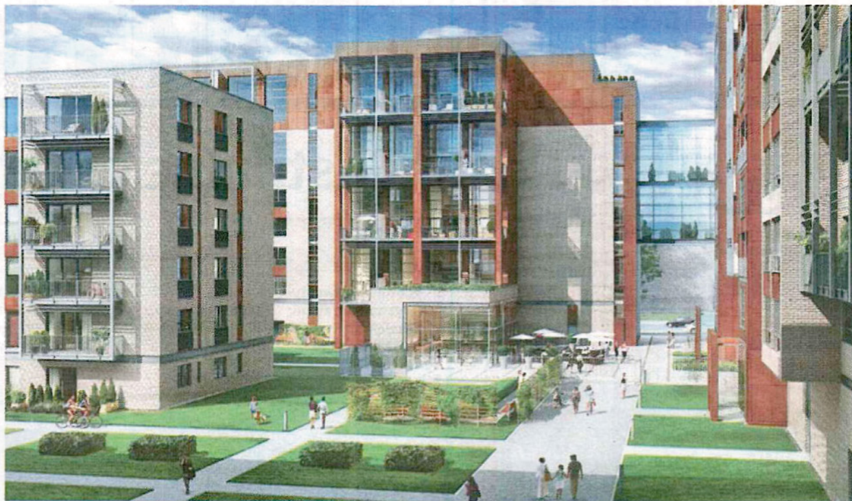
W środku osiedla planowany jest przestronny dziedziniec, na którym staną elementy małej architektury wkomponowane w zieleń

Pomysł na soft lofty nie jest przypadkowy. Aby zwiększyć atrakcyjność kompleksu, potrzebny był pomysł, który uwarunkowania najbliższego, postindustrialnego otoczenia zamieni w zaletę. Woronicza Qbik rośnie bowiem w poprzemysłowej części warszawskiego Mokotowa, a dokładnie na granicy Służewca Przemysłowego i Wyględowa. Ten pierwszy przeszedł w ciągu ostatnich kilkunastu lat poważną metamorfozę, ale w pobliżu nadal znajdują się dawne fabryczne zabudowania. W bezpośrednim sąsiedztwie zloka-