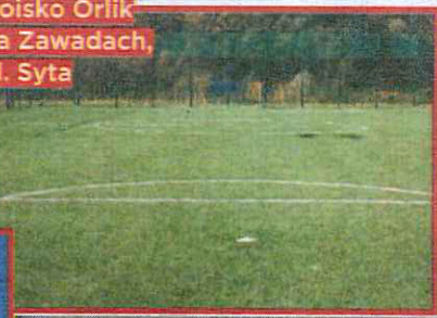
Boisko Orlik na Zawadach, ul. Syta

służy uczniom Szkoły Podstawowej nr 261 przy ul. Wiertniczej. W ostatnich latach o nowe lub przebudowane obiekty – boiska, hale, sale gimnastyczne, place zabaw, a nawet pływalnie, siłownie