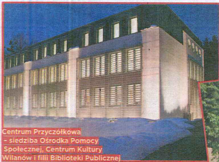
Centrum Przyczółkowa - siedziba Ośrodka Pomocy Społecznej, Centrum Kultury Wilanów i filii Biblioteki Publicznej

Centrum Przyczółkowa 27A, w którym miejsce znalazły filia biblioteki publicznej, Ośrodek Pomocy Społecznej i Centrum Kultury Wilanów – to tylko niektóre z inwestycji, zmieniających oblicze dzielnicy.