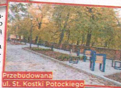
Przebudowana ul. St. Kostki Potockiego

W październiku 2010 r. została uroczystie otwarta i oddana do użytku nowoczesna Rejonowa Przychodnia Specjalistyczna przy ul. Przyczółkowej, która zastąpiła dotychczasowy, wysłużony obiekt znajdujący się pod tym samym adresem. W nowej placówce, oprócz poradni podstawowej opieki zdrowotnej dla dorosłych i dla dzieci, mieszczą się poradnie: ginekologiczno-położnicza, stomatologicz-