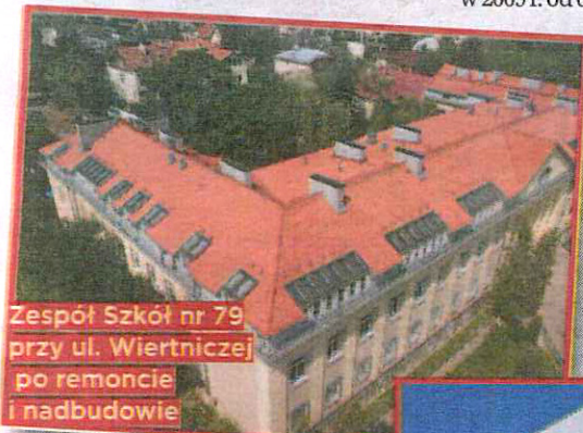
Zespół Szkół nr 79 przy ul. Wiertniczej po remoncie i nadbudowie