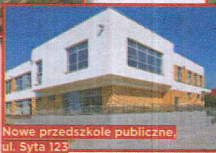
Nowe przedszkole publiczne, ul. Syta 123

Wydatki na oświatę zajmują znaczącą część budżetu, a skala zaangażowania inwestycyjnego w podniesienie standardu placówek oświatowych może być powodem do dumy wilanowskich samorządowców i mieszkańców dzielnicy. Co zrobiono? Wybudowano przedszkole przy ul. Sytej 123, wyremontowano oraz nadbudowano piętro budynku szkoły przy ul. Wiertniczej 26, wyremontowano salę gimnastyczną w Szkole Podstawowej nr 104 przy ul. Przyczół-