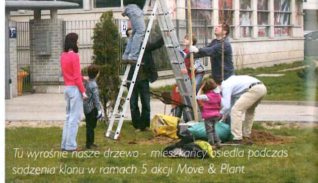
Tu wyrosnie nasze drzewo - mieszkańcy osiedla podczas sadzenia klonu w ramach 5 akcji Move & Plant