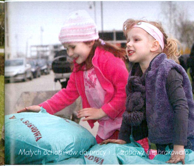
Małych ochotników do pracy i ... zabawy nie brakowało