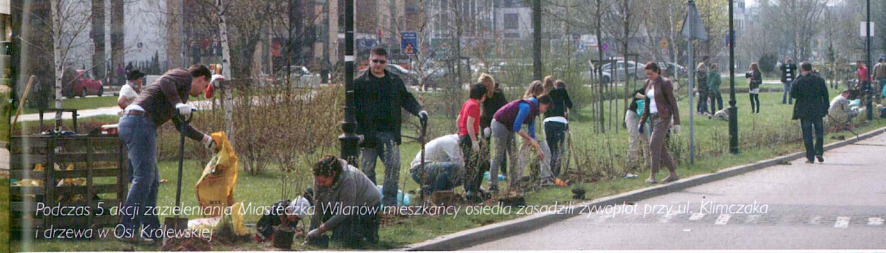
Podczas 5 akcji zazieleniania Miasteczka Wilanów mieszkańcy osiedla zasadzili żywopłot przy ul. Klimczaka i drzewa w Osi Królewskiej