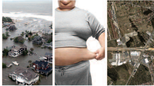
Kłęski żywiołowe / Problemy zdrowotne / Niekontrolowany rozwój miast