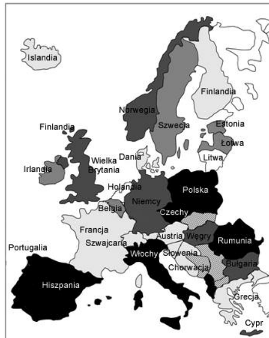
Statystyki otyłości w Europie

większenie wskaźników gęstości zabudowy na ściśle określonych terenach, wprowadzenie granic rozwoju urbanistycznego, ustanowienie bardziej szczegółowych wytycznych, dotyczących projektowania urbanistycznego, oraz zachęta do realizacji wielofunkcyjnych obiektów w ludzkiej skali.